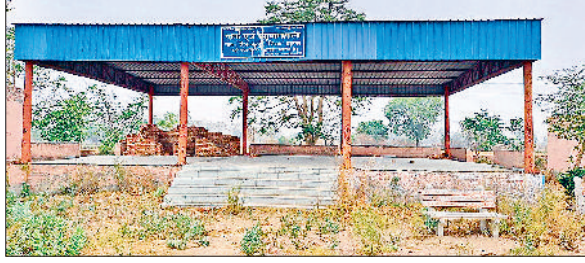
झज्जर। सिकंदरपुर गांव स्थित योग व व्यायामशाला।

आमजन को स्वस्थ व निरोग बनाए जाने के लिए ग्रामीण क्षेत्रों में खोली गई व्यायामशालाओं में अव्यवस्था व बदहाली साफ दिखाई दे रही है। जिले भर में खोली गई 126 व्यायामशालाएं रख-रखाव के अभाव में दम तोड़ रही हैं। व्यायामशाला में उगे झाड़, टूटी कसरत करने की मशीनें, बदहाल शौचालय देखकर साफ पता चलता है कि यहां आने की हिम्मत कैसे कोई कर सकता है। स्थिति यह है कि सांघ