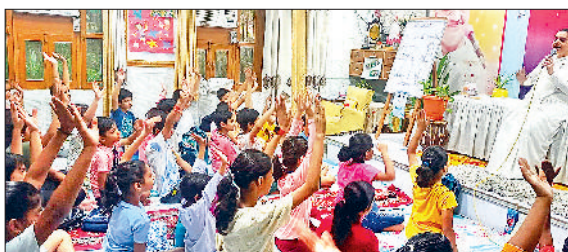
बहादुरगढ़। कैंप में बच्चों को नैतिक शिक्षा देती ब्रह्माकुमारी।