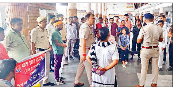
झज्जर। बस स्टैंड परिसर में आमजन को नशे के दुष्प्रभाव के प्रति जागरूक करते हुए पुलिस टीम।