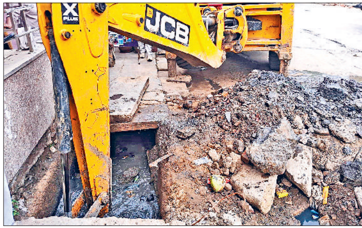
बहादुरगढ़। शहर में नालों की सफाई में जुटे कर्मचारी।

जी हां, नगर परिषद बहादुरगढ़ के अनुबंधित कर्मचारी नगर के विभिन्न स्थानों पर अब साफ सफाई करते नजर आ रहे हैं।