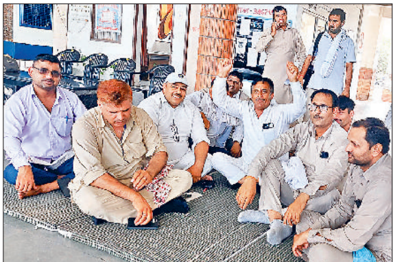
झज्जर। सांकेतिक भूख हड़ताल के दौरान सरकार विरोधी नारे लगाते हुए रोडवेज कर्मचारी।