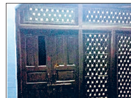
बहादुरगढ़। हमले में टूटा पीड़ित परिवार के मकान का दरवाजा।