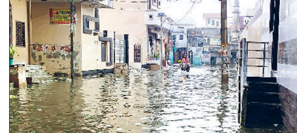
बहादुरगढ़। बरसात के बाद तालाब बना बाग वाला मौहल्ला, बरसाती पानी से लबालब भरी महावीर पार्क की गली, नेहरू पार्क की एक गली में जमा बरसाती पानी।

मानसून से पहले बुधवार को हुई बरसात ने लोगों को यहां खूब छकाया। जगह-जगह पानी भर गया और कई कालोनियों में मकानों से बाहर निकलना तक मुश्किल हो गया है। सब्जी मंडी से लेकर पुराना बस अड्डा जहां पानी से लबालब भर गया। वहीं कई सड़कों ने भी तालाब का रूप धारण कर लिया। मानसून से पहले आई इस बरसात ने प्रशासन के पानी निकासी के प्रबंधों की पोल खोल दी है। तेज बरसात आते ही शहरवासियों को गर्मी से तो राहत मिली, मगर जलनिकासी के कागजी इंतजामों ने उनकी उम्मीदों पर पानी फेर दिया। पहली बरसात से शहर में जो