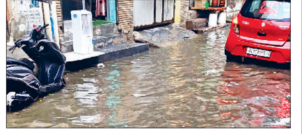
भुगतना पड़ रहा है। वहीं दूसरी ओर किसान बारिश पर खुशी मना रहे हैं और धान रोपाई के कार्य में एकदम से तेजी आ गई है। किसानों का