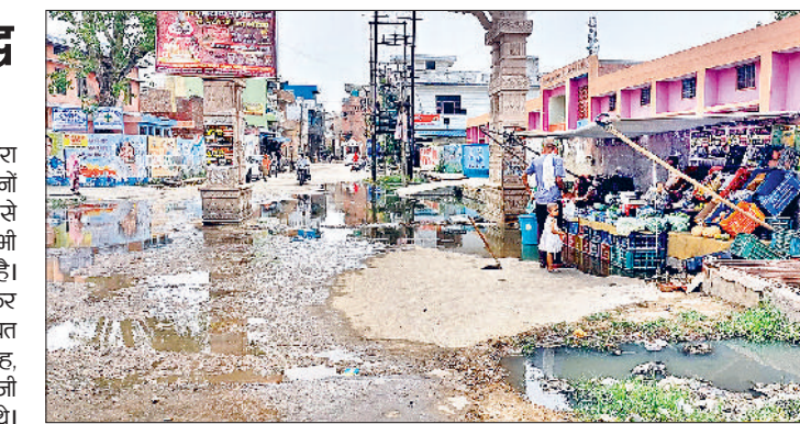
झज्जर। भट्टी गेट में नाला अवरुद्ध होने से सड़क पर फैला गंदा पानी।

अमी कुछ दिनों पहले ही सफाई कर्मचारियों द्वारा नाले की सफाई की गई थी जिसके बाद कुछ दिनों के लिए स्थिति सामान्य हुई लेकिन अब फिर से गंदा पानी सड़क पर फैलने लगा है। अमी क्षेत्र में नाले के कारण स्कूल के सामने सड़क पर गंदा पानी फैला रहता है वहीं मेन बाजार में थाना वाले पीर से लेकर नेताजी सुभाष चौक वाले अंडर ग्राउंड नालों की भी कुछ ऐसी ही स्थिति है। अमी क्षेत्र में नाले के कारण स्कूल के सामने सड़क पर गंदा पानी फैला रहता है वहीं मेन बाजार में थाना वाले पीर से लेकर नेताजी सुभाष चौक वाले अंडर ग्राउंड नालों की भी कुछ ऐसी ही स्थिति है।