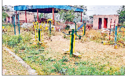
व्यायामशाला में उगे झाड़-झखंड।।

औपचारिकता ही निभा रहे हैं। धरातल पर सच्चाई क्या है, न तो वे योग सहायक अपने आलाधिकारियों को बता रहे हैं और न ही इनकी सुध लेने की जिज्ञासा है। कुल मिलाकर सरकारी रूपों का दुरुपयोग हो रहा है और आमजन को कोई लाभ नहीं मिल रहा है।