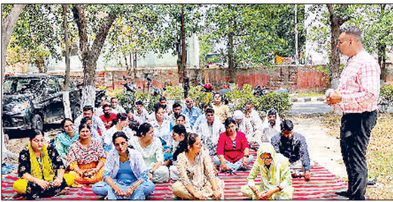
झज्जर। नागरिक अस्पताल परिसर में धरना देते हुए एनएचएम कर्मचारी।