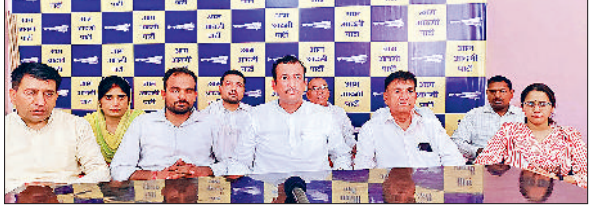
झज्जर। बैठक के दौरान उपस्थित आप कार्यकर्ता।

झज्जर। आम आदमी पार्टी के कार्यकर्ताओं ने प्रदेश संगठन मंत्री अश्वनी दुल्लेड़ा की अध्यक्षता में बदलाव जनसंवाद को लेकर बैठक की। इस दौरान उन्होंने बदलेंगे हरियाणा का हाल, अब लागू केजरीवाल अभियान को सफल बनाने के लिए कार्यकर्ताओं को आवश्यक दिशा निर्देश दिए। उन्होंने कहा कि हरियाणा को जनता ने एक बार सभी पार्टियों को मौका दिया। लेकिन उन्होंने हरियाणा के लोगों के लिए कुछ नहीं किया।