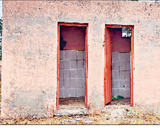
व्यायामशाला में बदहाल शौचालय।