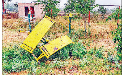
व्यायामशाला में टूटा पड़ा जिम का सामान।