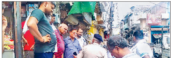
शोरूम में शांट सर्किट के कारण हुई आगजनी की घटना को देखते हुए उन्होंने सीसीटीवी सहित बिजली संबंधित सभी स्विच ऑफ करने शुरू कर दिए थे। इसी कारण वे बुधवार को भी अपनी दुकान की एमसी गिरा कर गए थे जिस कारण चोरी की वारदात सीसीटीवी में रिकार्ड नहीं हो पाई। उसकी दुकान से कुछ घरेलू सामान व गल्ले में रखी नकदी चोरी हुई है। इस घटना में खास बात यह है कि चोरों ने दुकानों का शटर खोलने बजाय छत की मांडंटी पर लगे

से परचूर की दुकान है। मंगलवार की रात करीब नौ बजे वह अपनी दुकान बंद करके घर चला गया था। बुधवार सुबह जब वह दुकान पर पहुंचा और ताला खोल कर देखा तो गल्ले में रखे एक लाख दस हजार रुपये गायब मिले। जब उसने दुकान का जायजा लिया तो उसे दुकान की छत पर लगाया गया लोहे का दरवाजा क्षतिग्रस्त मिला। इससे लगता है कि चोरों ने इसी दरवाजे से दाखिल होते हुए सीढ़ी के सहारे दुकान में प्रवेश किया। जब उसने चोरी की इस घटना का जिक्र अपने